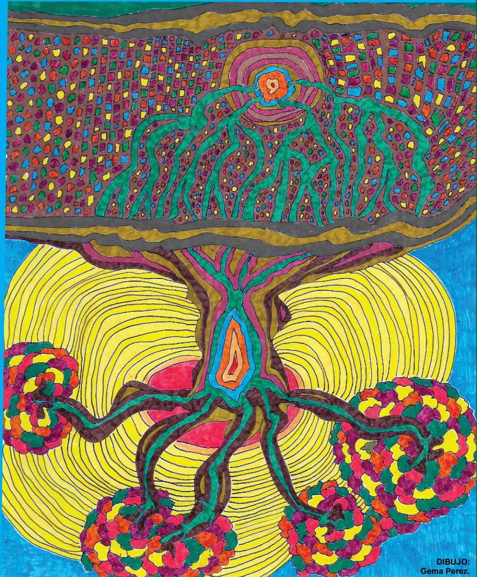
DIBUJO: Gema Perez.