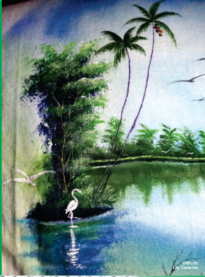
DIBUJO: Lily Calderón.