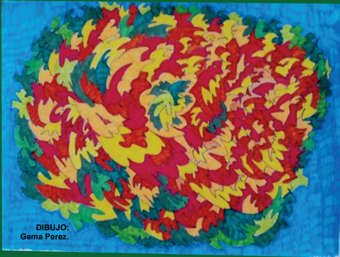
DIBUJO: Gema Perez.

Nas escolas e universidades Remamos contra as correntezas do machismo Sinodalizando saberes Partilhando as razões do nosso esperar e do nosso acreditar