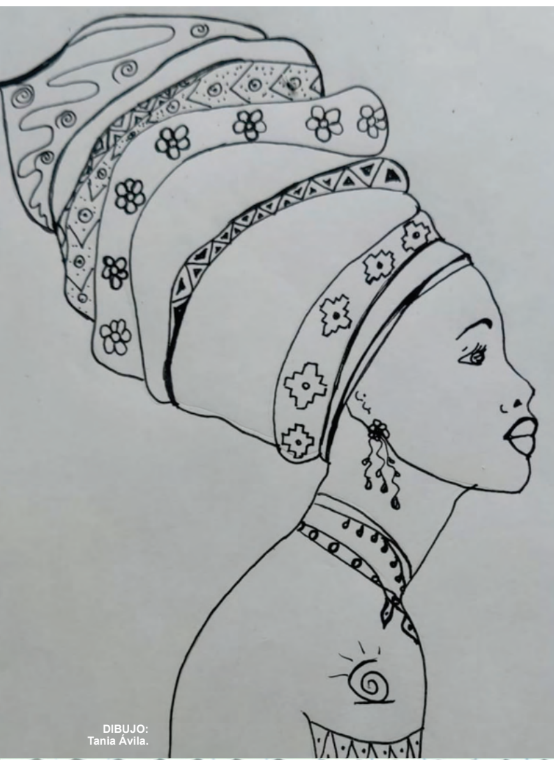
DIBUJO: Tania Avila.

En los ríos del Amazonas, pescamos nuestra comida, alimentamos nuestra fe en Dios encarnado en solidaridad con nuestras causas.