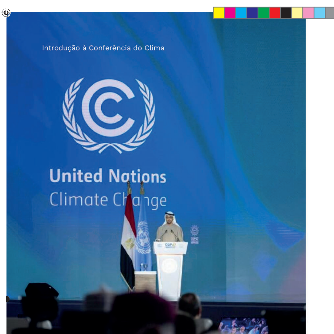
Conferencia COP27 realizada no egito.

NDC: plano de ação climática assumido por uma Parte no Acordo de Paris,